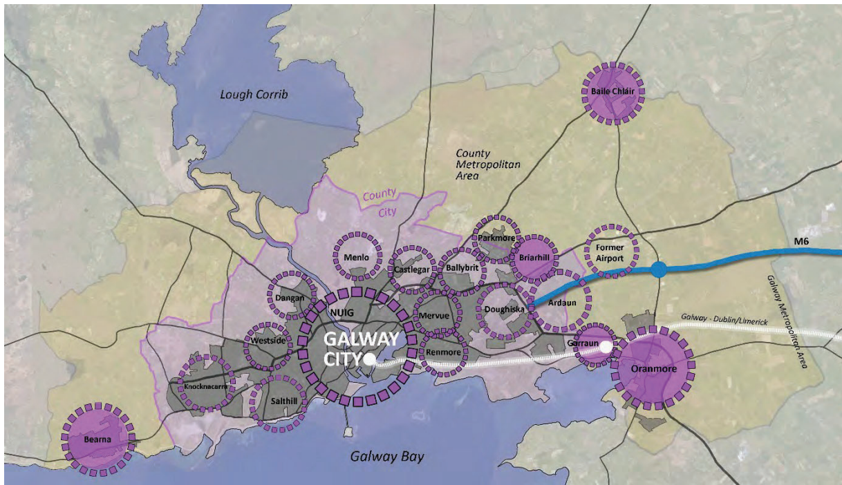
Fíor 1: Forléargas ar PSLC