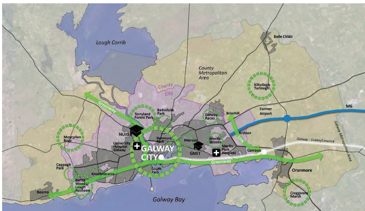
Fíor 2 Líonra Glas

Mar a léirítear i bhfíor 2 thuas, is ann do spásanna glasa/spásanna oscailte arna n-úsáid ag áitritheoirí agus cuairteoirí ar fud an dá limistéar riaracháin. Tá sé ar cheann de phríomhthosaíochtaí an plean seo líonra Ceannchathartha de spásanna oscailte, páirceanna, conairí glasa agus conairí eile a chur chun cinn. Mar a leagtar amach i gCuspóir Beartais Réigiúnach 3.6.13 den SRSE, tá tacaíocht ann chun Líonra Glasbhealaigh straitéisigh a chur ar fáil do na limistéir chun Rotharbhealach Náisiúnta Bhaile Átha Cliath-Ghaillimh, an Glasbhealach Cósta ó Órán Mór go Bearna agus an Glasbhealach ó Ghaillimh go dtí an Clochán a chuimsiú. Tá breis eolais le fáil maidir le tábhacht an bhonneagair ghlais i gCaibidil 9 Oidhreacht Nádúrtha, Bithéagsúlacht agus Bonneagar Glas.